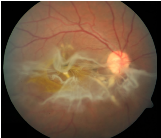
Makulaloch nach stumpfer Verletzung

Kleine Löcher können sich manchmal spontan verschließen. Manche Makulalöcher können auch mit einem in den Glaskörper eingegebenen Wirkstoff (Ocriplasmin) entlastet und verschlossen werden. Große zentrale Netzhautlöcher profitieren von einer Netzhautoperation mit speziellem Lochverschluss und Gas- bzw. Silikonölfüllung. Wir bevorzugen die invertierte Flap-Technik. Dabei wird eine kleine Membran über das Loch gelegt und dieses somit abgedeckt.